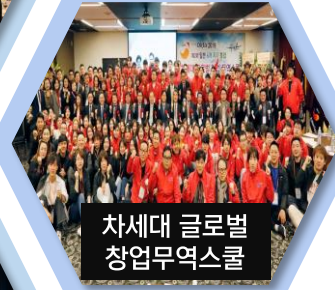
차세대 글로벌 창업무역스쿨