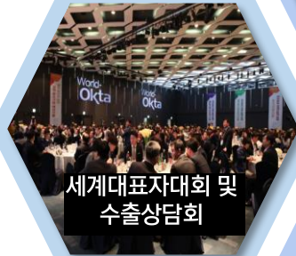
세계대표자대회 및 수출상담회